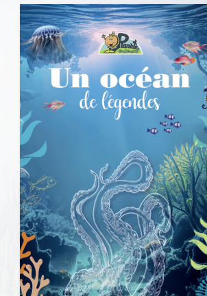
Un océan de légendes